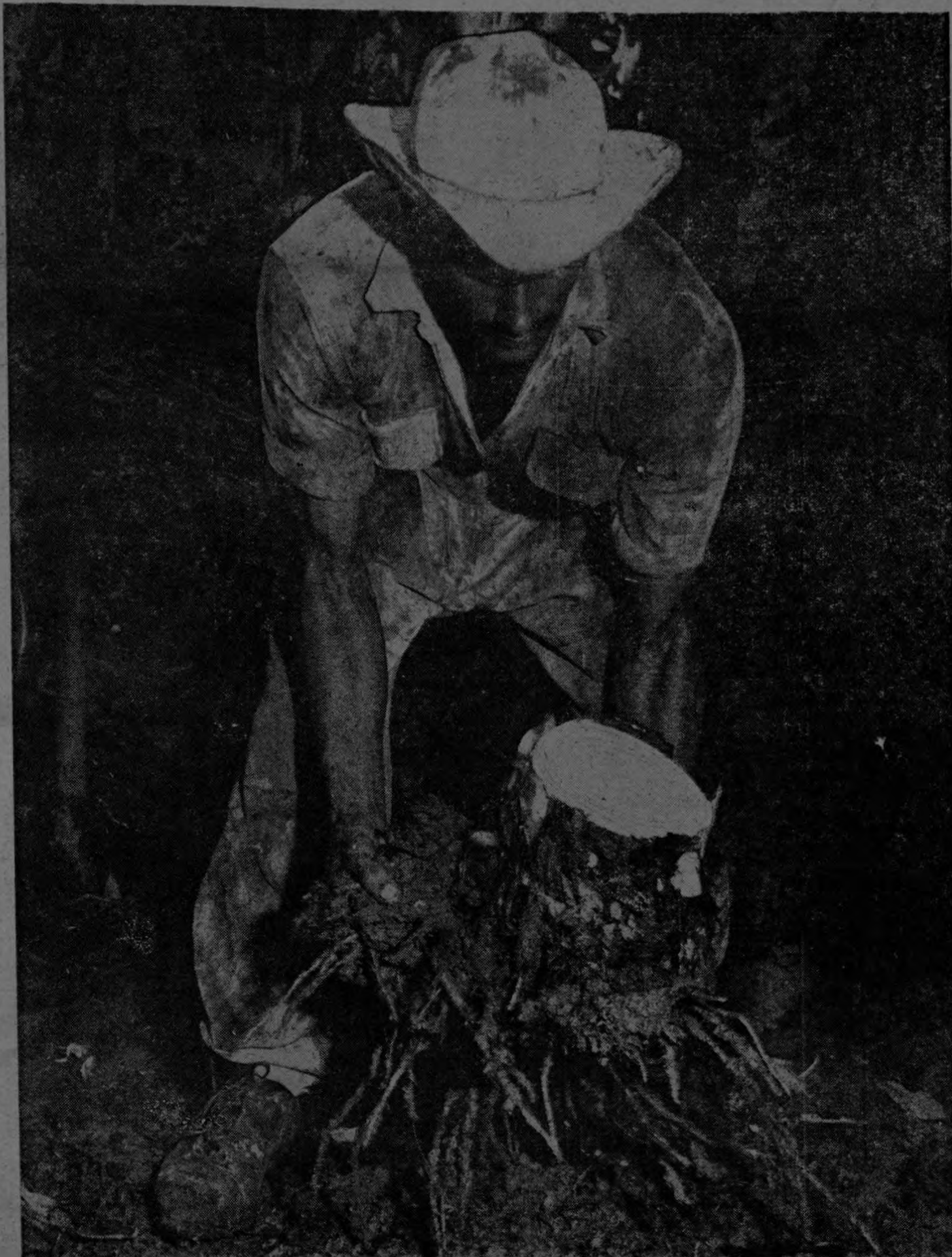
Un trabajador bananero, extrae cuidadosamente un bulbo debidamente seleccionado para las nuevas plantaciones bananeras en el distrito de Coto.